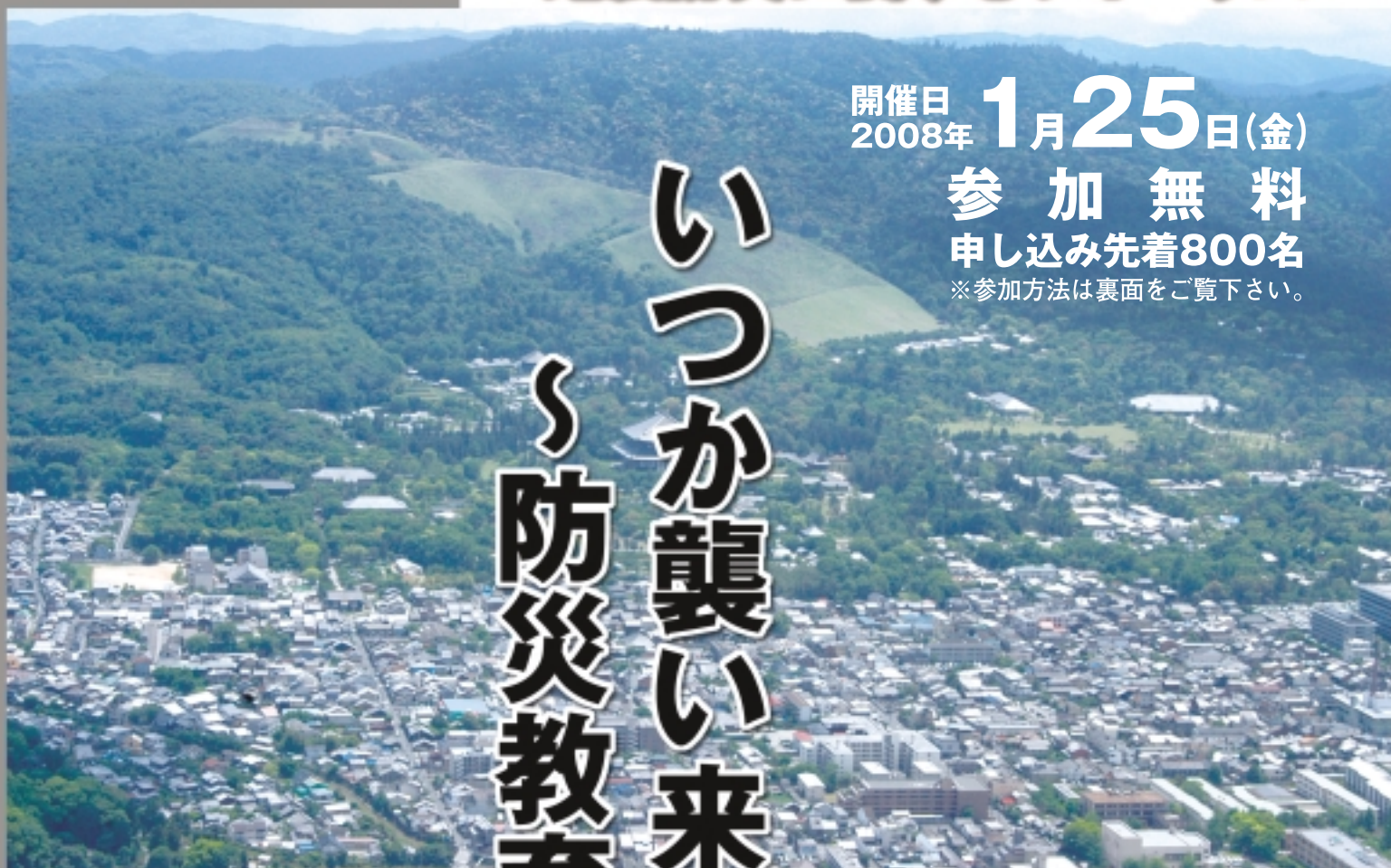
奈良盆地東縁断層帯が奈良公園の直下を走る。