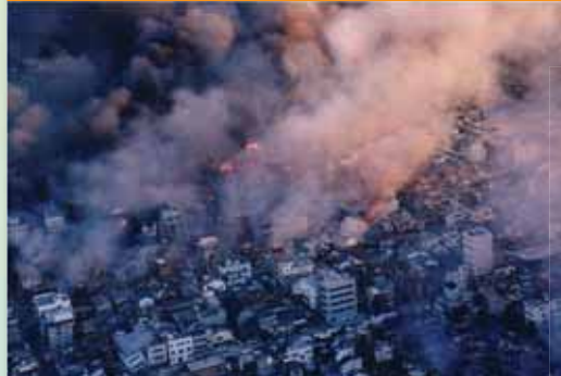
④1995年(平成7年)兵庫県南部地震 M7.3