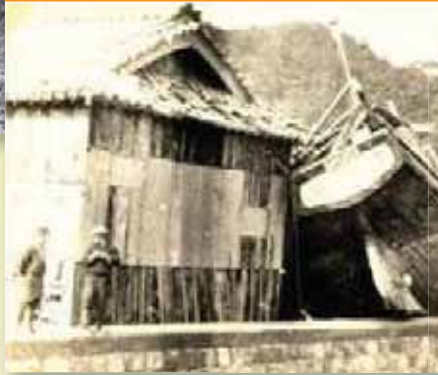
②1946年(昭和21年)南海地震 M8.0