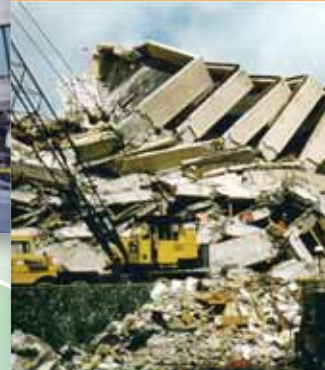
⑧1990年 フィリピン地震