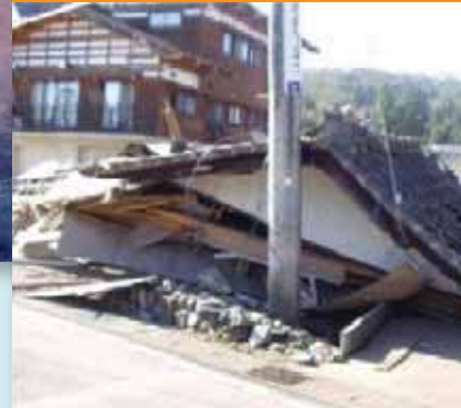
⑤2004年(平成16年)新潟県中越地震