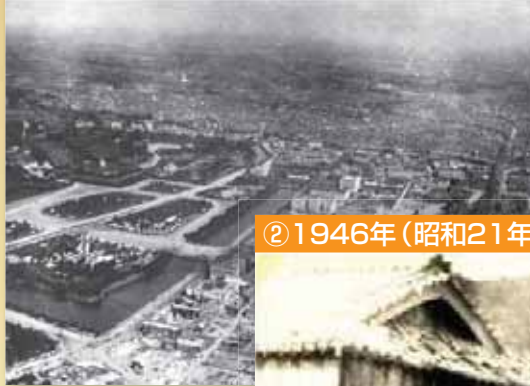
①1923年(大正12年)関東地震 M7.9