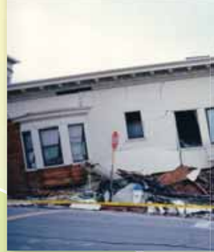
⑦1989年 アメリカ合衆国 ロマプリータ地震 M7.1