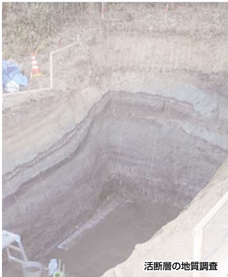
活断層の地質調査