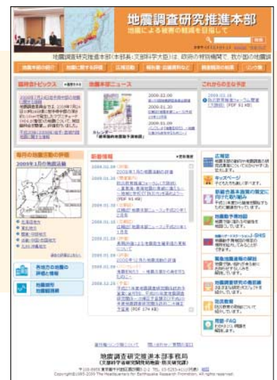
地震調査研究推進本部ホームページ

ホームページ http://www.jishin.go.jp/ 検索ワード 地震調査 検索 [キッズページ] http://www.jishin.go.jp/kids/ 地震本部ニュース http://www.jishin.go.jp/main/p_koho04.htm