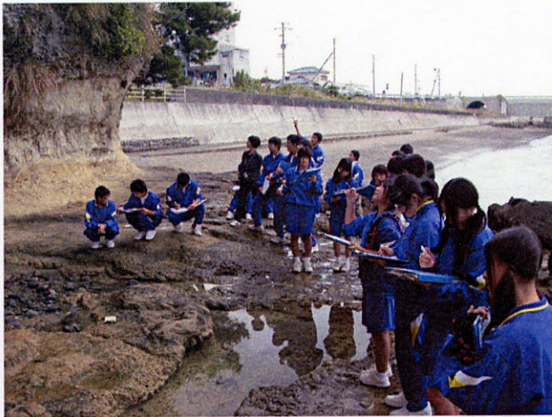
図4 龍石海岸を観察している様子

龍石海岸は200～70万年前の口の津層群(主に海成層)の上に、50万年前の雲仙最初の噴火である火砕流堆積物がのる。その上に30万年前からの雲仙火山の土石流堆積物がのる。これらは不整合や層理をともなっており、地層観察に適している。