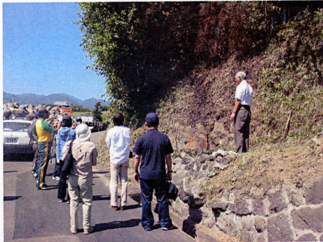
図5 長貫断層を教材化している様子

写真は三会中学校から500mの地点にある長貫断層の露頭である。左の道路と右側の台地の標高が10mほどずれている。その境界付近の崖に長貫断層に平行に割れ目が走っているのが観察される。これは長貫断層に伴う、破碎帯と考えられる。