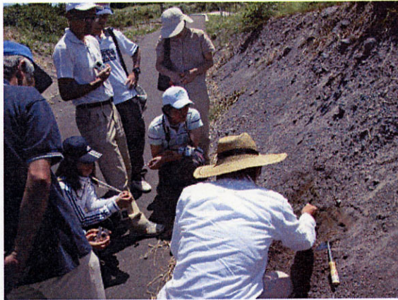
図3 垂木台地の火山灰層の教材化の様子

島原市周辺は雲仙火山の火山山麓扇状地が発達していて、地形が新しいため、その断面を観察するのは困難である。また、海成層の地層は付近にはなく地層観察には条件が悪い。ところが垂木台地には平成の噴火で堆積した火山灰や火砕流堆積物が地層をなして堆積している。昨年、遊歩道の造成時に現れた露頭に、コンクリート吹きつけをしないよう県に働きかけた。そのおかげで露頭は保存されいつでも観察できるようになった。