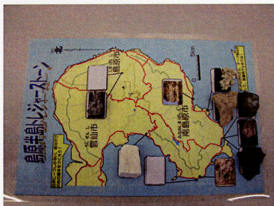
図2 島原半島に石を貼り付けている様子